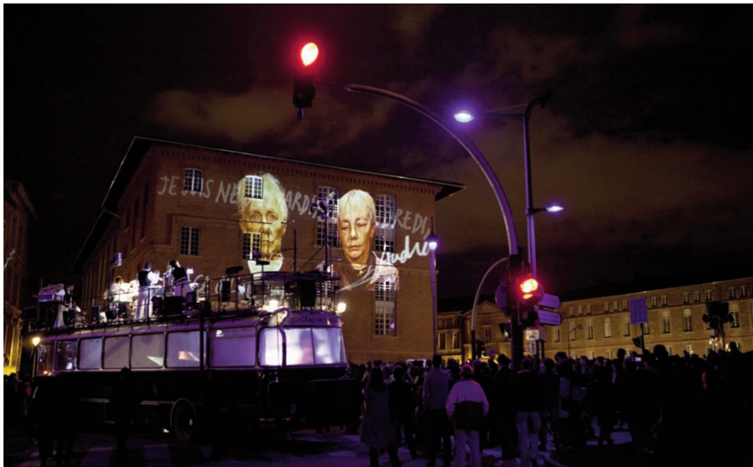
Figures Libres, 2012