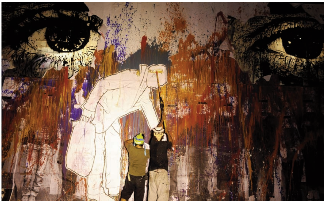
Memento , 2009 © Vincent Muteau

En parallèle, KompleXKapharnaüm initie dès 2002 EnCours , dispositif d'accueil d'artistes en résidence et d'interventions artistiques dans le quartier de la Soie à Villeurbanne.